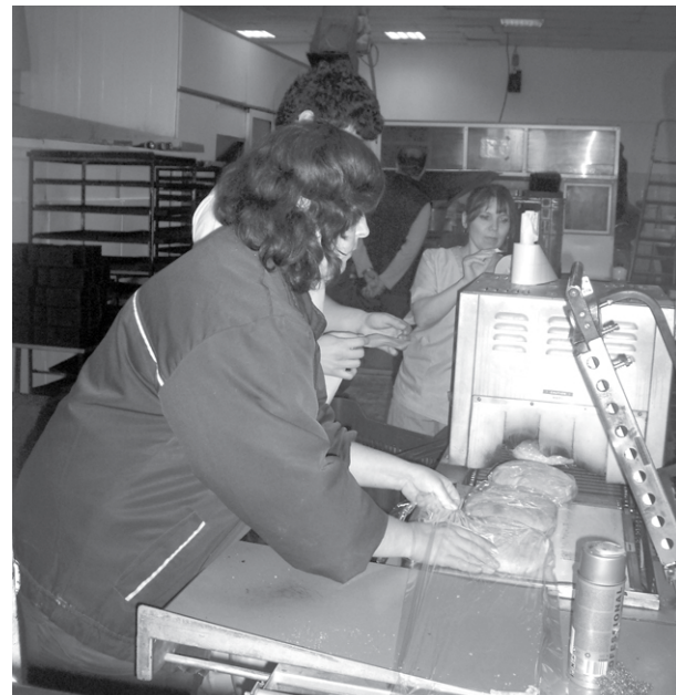
Хлябът на най-големия във Видинско производител се предлага на пазара обвит в по-скъпото, но и с високо качество италианско фолио.

Стойков: Фирмата „Зърнени храни - Видин 99” АД не предлага хляб,