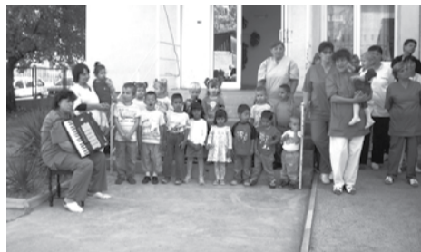
„Скъпоценните камъни на пръстена на Малтийския орден“, както нарече посланикът потомците на Дома за медико-социални грижи за деца във Видин, изпълниха литературно-художествена програма пред дарителите.