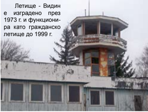
Летище - Видин е изградено през 1973 г. и функционира като гражданско летище до 1999 г.

сградостроително училище – се охранява от областната управа и е в оптимално състояние. Другата – на бившето епархийско училище – е дадена на разположение от НВП митрополит Дометиан.