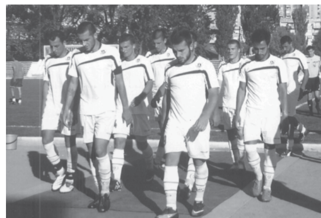
След победата си над „Мелаш“ – Микрево с 2:0 видинските футболисти вече заемат трето място в Западната „Б“ група. До края на сезона те може да се изкачат и на върха.

Израва се и срещите от третия кръг на областното първенство по футбол. Впечатлява отборът на „Тимок“ – Брегово, който като гост на миналогодишния първенец „Ботев“ – Грамада завърши наравно - 2:2, и остава начело на групата без загубена среща. Ето и останалите резултати, представени за вестник „Ние“ от секретаря на ОС на БФС Христофор Ерменков – Фори: Старопатица – Макреш 3:0, Ново село – Орешец 3:1 и Дунавци – Кула 5:0. Макар и със закъснения от два кръга в първенството