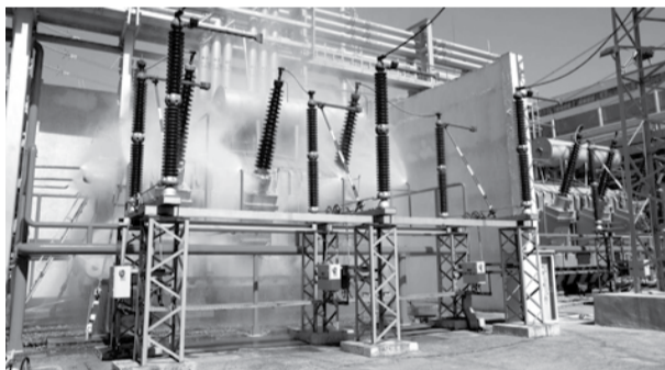
Изпитания на системата за пожарогасене на резервни трансформатори на 5 блок.

Решението за провеждане на стрес тестове в АЕЦ "Козлодуй" бе взето на иницираната от министър-председателя на Република България Бойко Борисов среща с ръководството на централата, проведена на 21 март 2011 г. в Министерския съвет. В изпълнение на това решение на 23 март в атомната централа бе проведено разширено заседание на съвет "Безопасност и качество", на което бяха набелязани необходимите действия за провеждане на стрес тестове. В заседанието участваха представители на Агенцията за ядрено регулиране (АЯР), на Министерството на икономиката, енергетиката и туризма, на Института по ядрени изследвания и ядрена енергетика (ИЯИЯЕ) при Българска академия на науките (БАН) и на Областната управа – Враца. Създаден бе Щаб за ръководство, координация