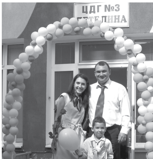
Семейство Гергови на 15 септември в детска градина "Детелина".

Не можем да си позволим хората, на които сме поверили децата си, да не бъдат