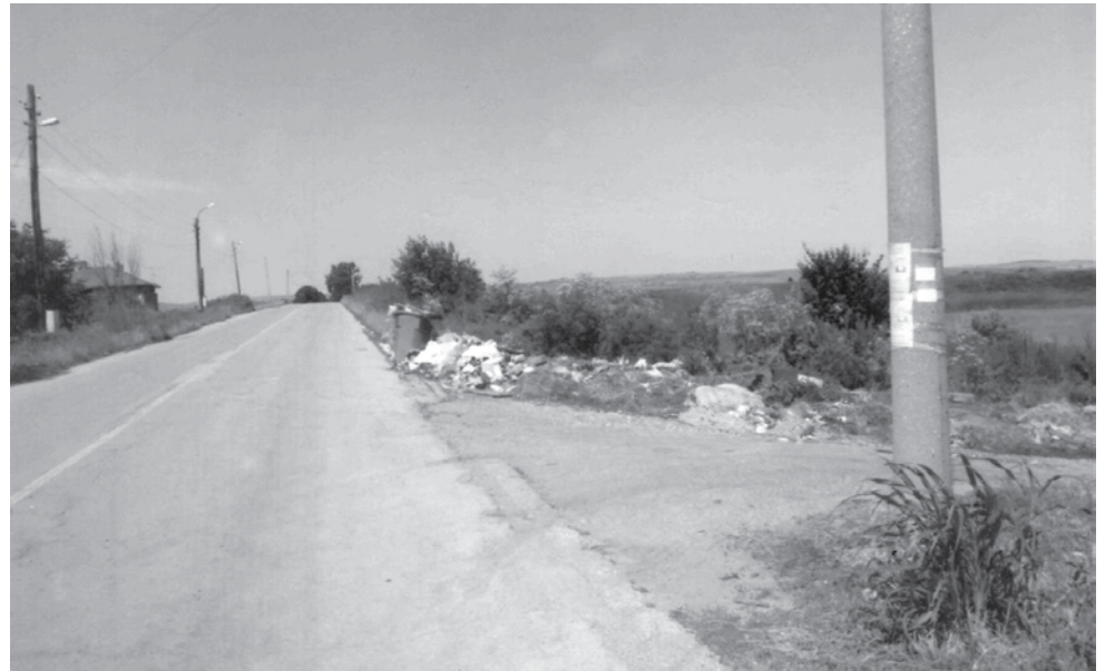
Това е изходът за гр. Кула! Росенчо на море с Видов, че могат да харчат безконтролно нашите пари – а на нас остават мизерия! (Общинската администрация на Видин често-често дава на чистещата фирма огромни пари над предвидените в бюджета уж за почистване на нерегламентирани сметища. В същото време сметищата се трупат, а кметът не се и опитва да залови тези, които хвърлят боклуците си, нито да го глоби, както подобава – бел. на в. „НИЕ“.)

С уважение: Ц.К., Видин