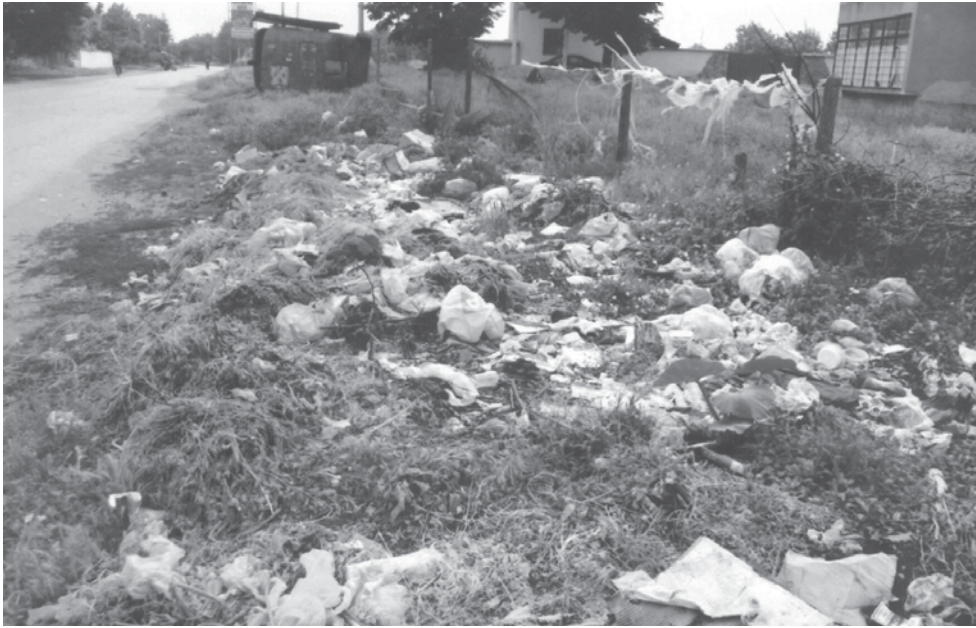
Тук, от тази спирка в с. Новоселци всяка сутрин отпътувам за Видин. Това е спирката до стопанския двор. Зараза! Мръсотия! А нашите управници пропиляха няколко хиляди лв. за луксозни хотели и плаж на Балчик.

Уважаема редакция, Вестник "НИЕ" е единственият, който публикува и добрите, и лошите неща за тези, които ни управляват. Когато прочетох за „Росенчо от с. Крива бара“, се позаинтересувах за него. Какво ме накара – той работеше в „Напоителни системи“, когато изчезна един цял траф. И тогава, за да не го уволнят, го покриха и изпатиха други хора. От-