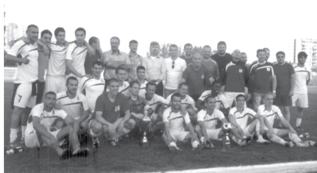
„Бдин” – Видин минути след награждаването с ръководството на клуба и гостите на възвращащото тържество.