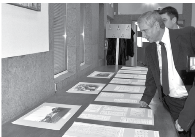
С интерес посланикът на Израел разгледа документалната изложба, включваща документи и архивни снимки за живота на известния художник Жул Паскин, роден в дунавския град в семейството на известната еврейска фамилия Пинкас

региона. На първо място той посочи, че градът се