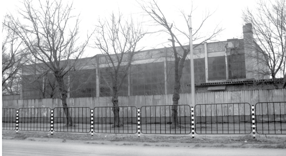
Какво ли мислят зад желязната ограда? Оставената да се руши спортна зала и футболният терен зад нея са апетитно парче за приватизиране в тия смутни времена