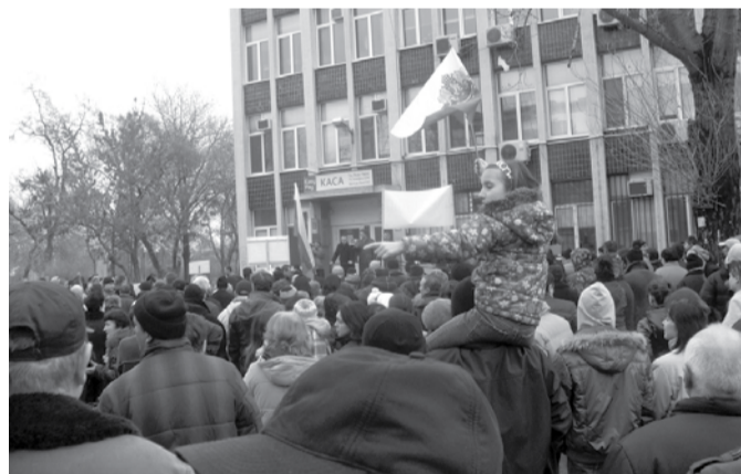
От Спортната зала протестиращите се насочиха към сградата на Енергото, където отново прозвучаха лозунги срещу енергийния монополист, бяха разветви знамена и бяха издигнати плакати

Така че призивите „ЧЕЗ във от България!“, „Вън на монополите!“ и „Всеки ден