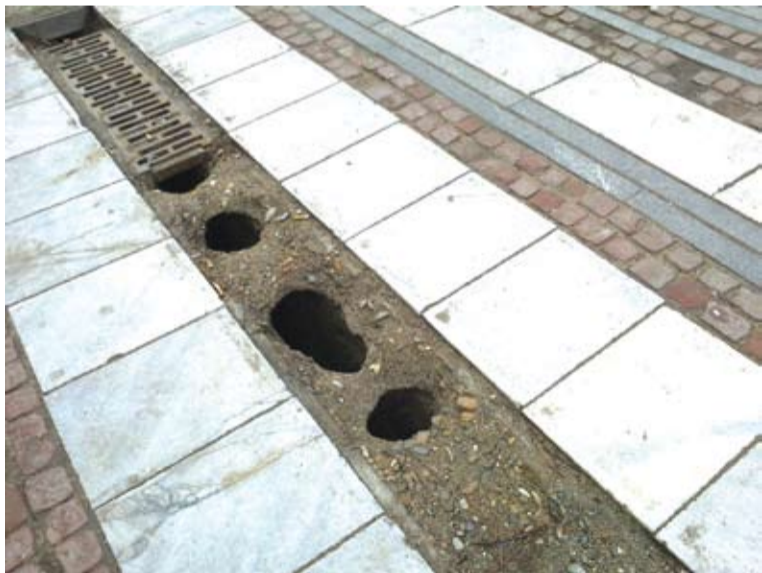
Зейналите дупки са готови да грабнат нечие невнимателно стъпило ходило

Във Видин сме свикнали с траповете по улиците, които с времето зейват все по-дълбоки и постепенно „изяждат“ все по-голяма част от асфалта на уличното платно. Дупки обаче съвсем не се намират единствено по уличните платна на града – те започват, както зараза при епидемия, да обхващат и пешеходните зони на Видин.