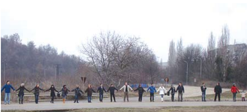
Около 1500 души се събраха на 16.02.2013 г. на протест в Монтана срещу високите сметки за ток. Протестът започна пред сградата на ЧЕЗ в града и се превърна в шествие до Черния мост в града. Хванати за ръце протестиращите скандираха "Мафия!" до изхода на града към Враца и Берковица. "Имаме сметка за ток за 260 лв., а сме изхарчили 150", сподели протестиращ гражданин пред в. „НИЕ“.