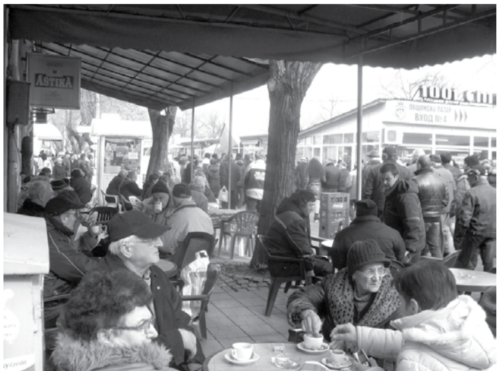
Докато едни протестират, други пийват кафенце