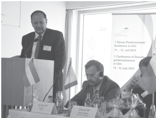
Михаил Миков пред парламентаристите на дунавските държави

В посланието си към участниците в конференцията Михаил Миков определи тази Първа конференция на парламентаристи от Дунавския регион като навременна и особено ценна инициатива, провеждаща се до извора на Дунав – реката с най-силно иззявено международно измерение в целия свят. Според него парламентаристите са длъжни пряко да се ангажират с оползотворяване на потенциала на региона в интерес на благоден-