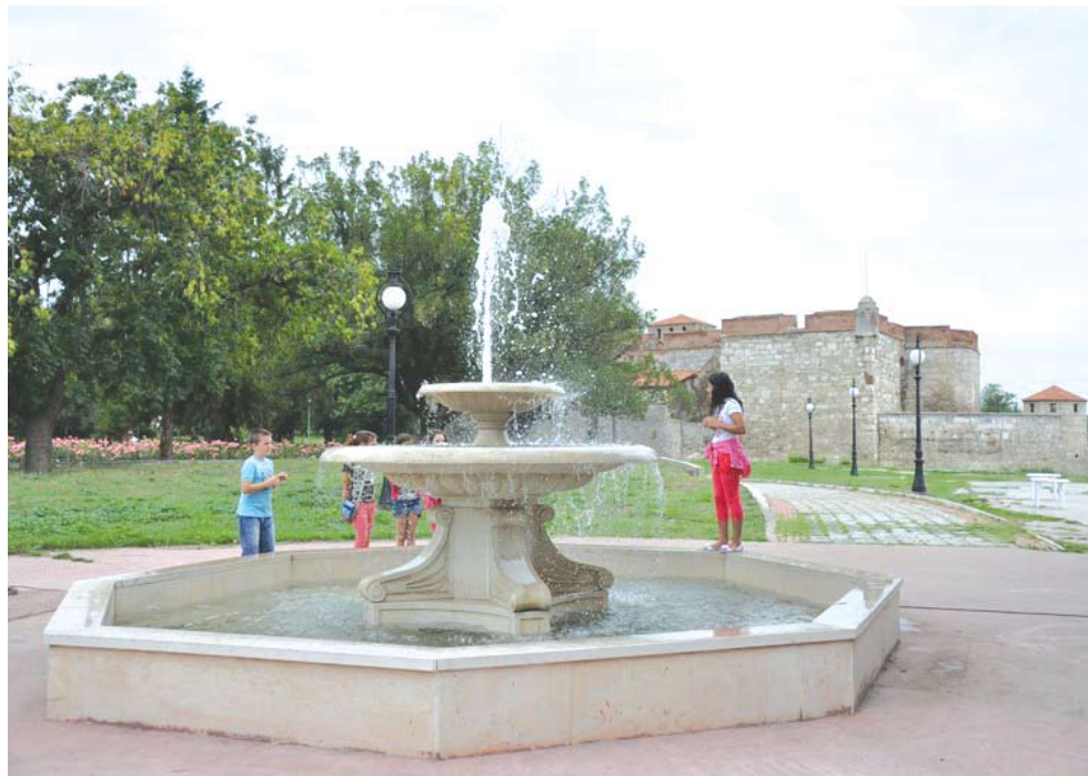
Около работещия фонтан вече се събират деца

Повече от 10 години фонтанът в близост до градския плаж на Видин не рабо-