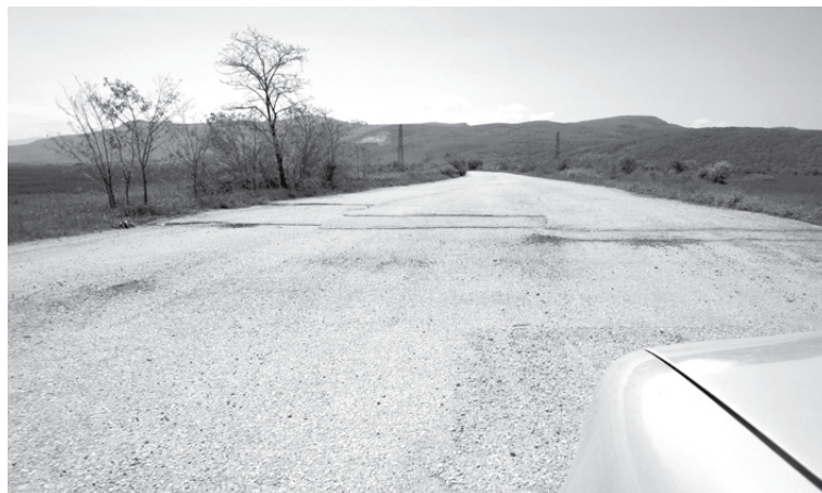
Вече четвърт век новият път Димово – Ружинци (дори на места са положени всички асфалтови пластове) чака да бъде довършен

Повече четете на стр. 4 ТЕОДОРА МАКАВЕЕВА