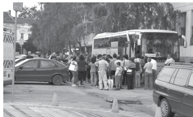
Видински деца с вълнение се качиха на автобуса, който ги откарва на море

проведе на 12 юни, ръководителите на групата и родителите на децата бяха запознати с изискванията и документацията за безопасност и културно поведение по време на летуването. Лагерът ще продължи от 11 до 21 юли.