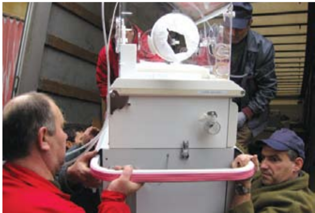
Работещи във видинската болница разтоварват дарението, сред което е този кувъз за новородени