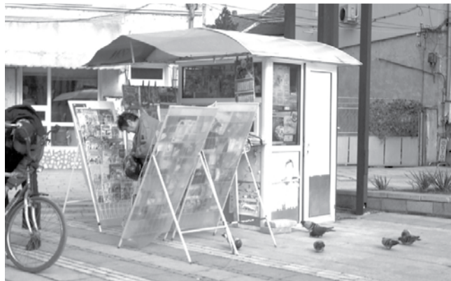
Предстои да се разбере дали видинските общински съветници ще допуснат монополист на пазара на цигари, вестници и захарни изделия във Видин, от което най-много биха пострадали собствениците и работещите в павилиони

Това инвестиционно предложение на тютюневата компания скара съвет-